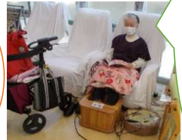
じんわりと温かくなります