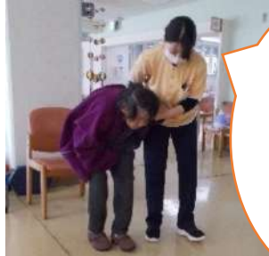
自分の脚でしっかりと歩けるようにサポートしていきますね