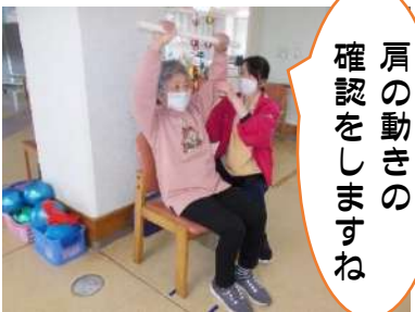
肩の動きの確認をしますね